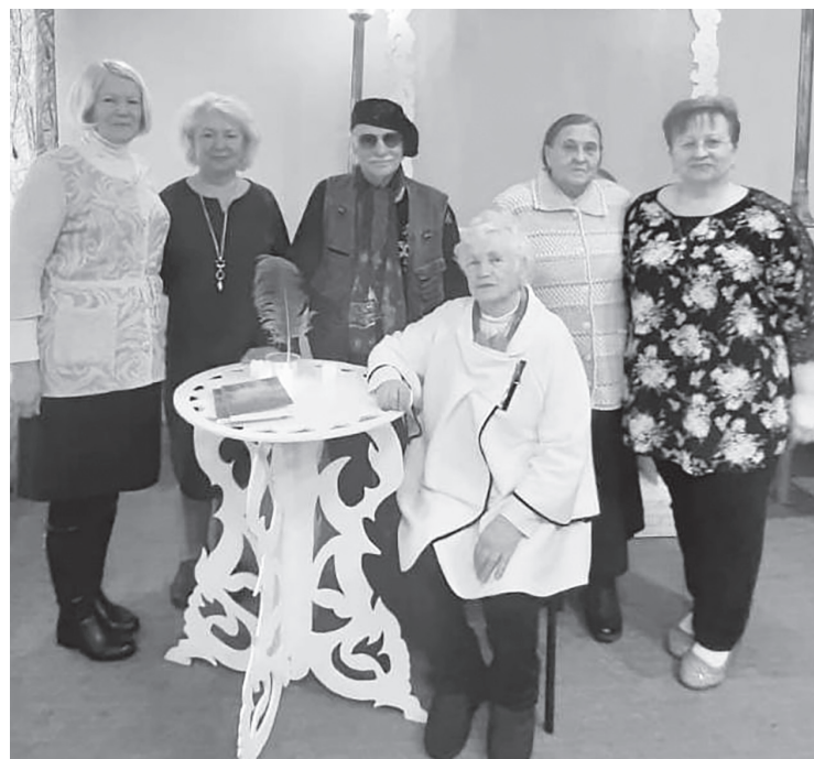
По материалам страниц Вконтакте Крестецкой межпоселенческой библиотеки и Пролетарского районного Дома культуры и досуга

В заключение мероприятий авторы подарили присутствующим книги со своими автографами и сфотографировались на память.